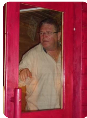
Ohne Worte ;)